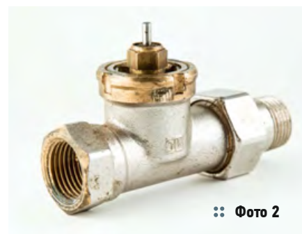
:: Фото 2

Датская компания предоставила заказчику радиаторные терморегуляторы, термостатические клапаны с накидной гайкой (позже названные «американками») и другое оборудование для установки на всех отопительных приборах гостиничного комплекса. На каждом латунном изделии производитель поставил фирменное клеймо — «D» (заглавная буква в названии компании Danfoss), а на оборотной стороне корпуса нанёс аббревиатуру «DIN» (фото 1 и 2). Это официальное свидетельство европейского качества товара, подтверждённое Немецким институтом по стандартизации (Deutsches Institut für Normung e.V., DIN), традиционно используемое многими производителями Европы до сих пор.