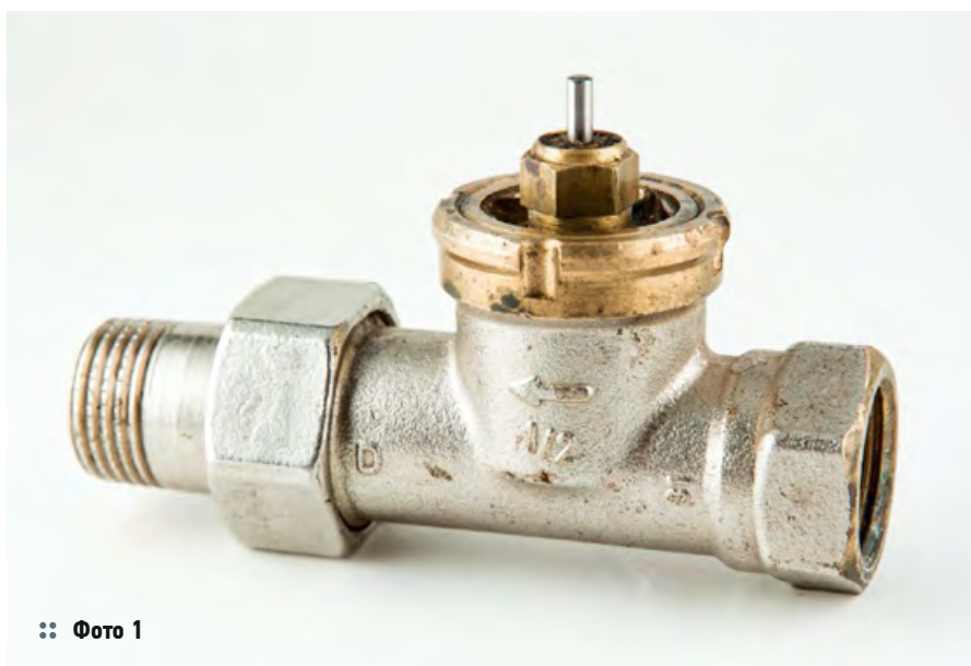
:: Фото 1