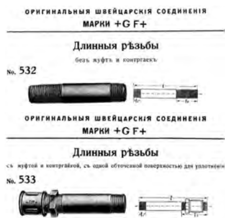
❖ Фото 9. Дореволюционные сгоны

На рубеже XIX–XX веков сгоны уже применялись при монтаже сантехники в Европе и в царской России. Это видно по чёрно-белым иллюстрациям сгонов в швейцарском каталоге 1912 года (фото 9). Однако во второй половине прошлого века их постепенно вытеснили и заменили в Европе фитингами и кранами с накидной гайкой. Что касается России и постсоветских республик, то сгоны здесь востребованы до сих пор и часто используются в монтажных работах.