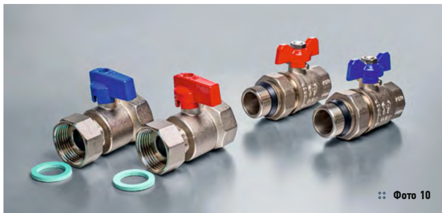
❖ Фото 10

Усовершенствование же инженерной сантехники в Европе не останавливается, в том числе в ассортименте комплектующих деталей для коллекторных систем. Компания Profactor Armaturen GmbH поставляет в Россию шаровые краны PF MB 847 с полусгоном (фото 10), в соединении которых есть нюанс — наружная резьба. Чтобы установить такой кран, необходим переходной фитинг — муфта. С появлением же новых типов шаровых кранов