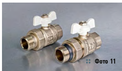
❖ Фото 11

Кроме того, в Европе модернизировали шаровые краны-американки с полусгоном для водопроводных систем. Немецкие производители выпускают «американки» с кольцевым уплотнением полусгона. Например, под торговой маркой PROFACTOR производятся шаровые краны серии STANDARD с присоединённым кольцом из синтетического полимера NBR (бутадиен-нитрильный каучук), которое заменяет и не требует применения уплотнительных материалов (фото 11).