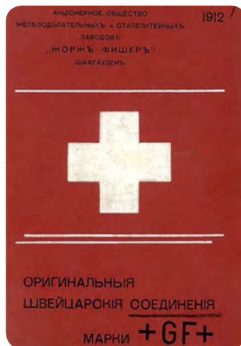
⌘ Дореволюционный каталог «Оригинальные Швейцарские Соединения Марки +GF+» Акционерного общества «ЖОРЖЪ ФИШЕРЪ»

В странах Европы и Азии, Южной и Северной Америки приняты совершенно разные наименования арматуры с накидной гайкой и ни одно из них не совпадает с русским обозначением. Немцы, например, называют арматуру с накидной гайкой Verschraubung. Но история соединения начинается не в Германии, а в Швейцарии