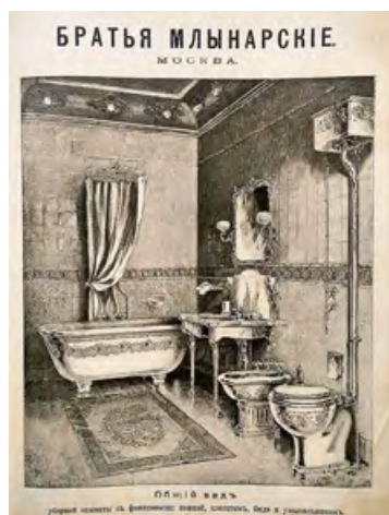
⌘ Страница из каталога Торгового дома «Братья Млынарские»