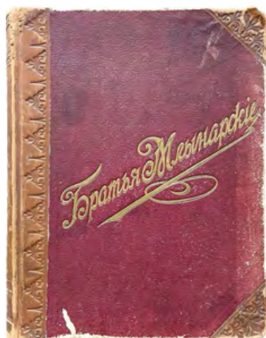
⌘ Дореволюционный каталог сантехнических товаров Торгового дома «Братья Млынарские»

В компании Profactor Armaturen GmbH сохранился раритетный каталог «Оригинальные Швейцарские Соединения Марки +GF+», выпущенный в 1912 году Акционерным обществом железодельных и сталелитейных заводов «ЖОРЖЪ ФИШЕРЪ», располагавшемся в северном кантоне Швейцарии Шаффхаузен (Schaffhausen) — см. фото.