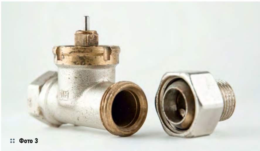
⌘ Фото 3

В компании Profactor Armaturen GmbH сохранилась одна из деталей Danfoss, установленная во время строительства гостиницы «Россия». Латунный термостатический клапан исправно работал в системе отопления около сорока лет, пока его не демонтировали в 2010 году до полного сноса легендарного здания. Невероятно, но после столь долгой эксплуатации клапан выглядит как вполне современное и практически новое изделие (фото 3 и 4).