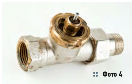
⌘ Фото 4

По условиям контракта Danfoss брала на себя обслуживание оборудования и гарантировала замену в случае поломки или выхода деталей из строя. Эти услуги датская фирма оказывала до 2006 года, то есть до момента закрытия гостиницы «Россия». За сорок лет эксплуатации изделия европейского качества ни разу не подвели. Более того, их выкручивали и приспособивали к отопительным приборам на других объектах.